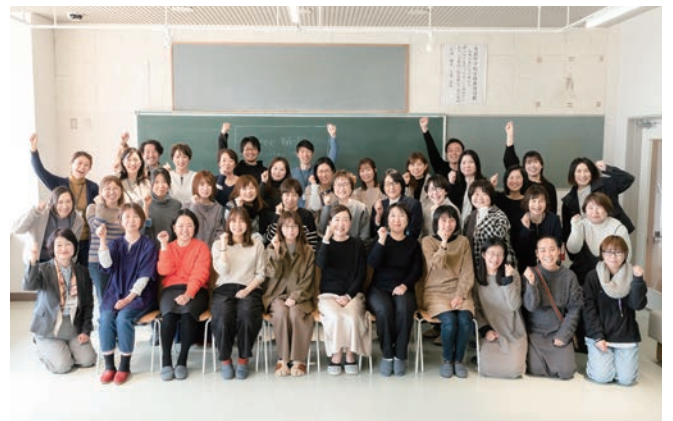
主催:ウィメンズアイ、共催:気仙沼市、協力:ロクシタン、True Data、他