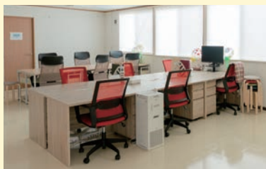
子育て中の女性が働きやすい職場を目指す場

女性がライフスタイルに合わせて継続的に働きながらスキルアップできる「オフィスミモザ」事業にWEは参画しています。本事業は、IT分野における女性の雇用機会を創出し、特に子育て中の女性が安心して働ける環境づくりを目的としています。2022年春に開設された「大谷海岸オフィスミモザ」は、気仙沼市、(株) True Data、NPO法人「人間の安全保障」フォーラムとの包括連携協定に基づきスタートしました。2024年5月からはTrue Data社からの業務をWEが受託し、地域在住の女性がデータメンテナンス業務に従事しています。初年度は、業務を正確に遂行することを積み重ねてきましたが、事業開始から約10か月を経て、次のステージとして、業務のチェック機能を自分たちで担う体制づくりに挑戦を始めました。また、子どもの発熱や学校行事など、家庭の事情に応じて柔軟に対応できる体制を大切にしています。ミモザは単なる就労の場ではなく、「地域で働き続けられる」モデルを育てる拠点です。今後も、女性たちが安心して挑戦できる環境づくりを進めていきます。