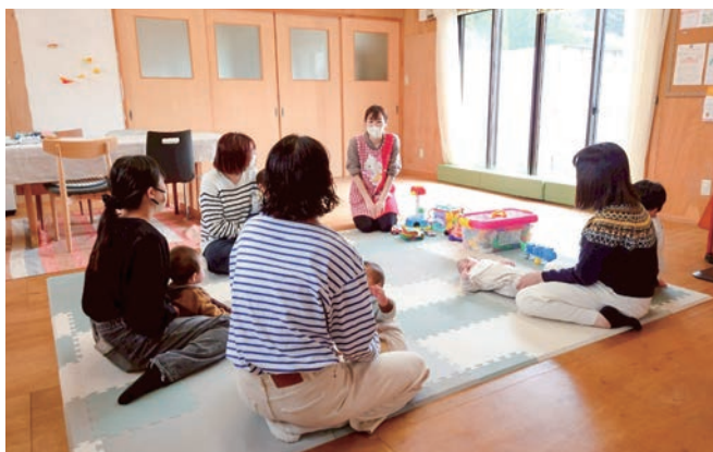
乳児親子の交流を目的とした「0歳さん、あつまれー」の様子

ママと赤ちゃんのサポート「ゆるりん」は、月に2～3回開所し、延べ40組の親子が参加しました。参加者の多くは、初回利用時には緊張が見られましたが、回数を重ねるうちに、親子で安心して過ごすようになり、他の親子との交流が生まれるようになりました。