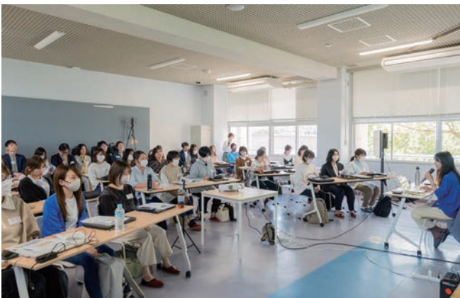
旧中学校を活用したシェアオフィス「ITベース大島アスナロウ荘」で開催。