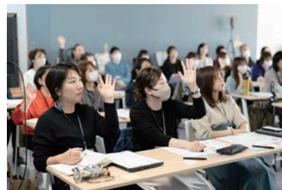
3回の対面講座では、テキストコミュニケーションなど実践的なスキルを学んだ

上が確認され、受講生の多くが学びを日常の業務や今後の働き方に活かしています。デジカレは、地域女性の就労機会とデジタル力の底上げだけでなく、学びを継続し支え合う仲間とのつながりを担う場となっています。