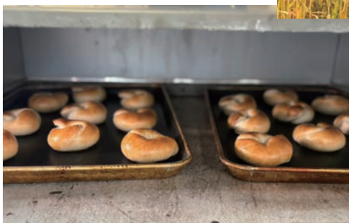
ouiで定番商品として親しまれているベーグル