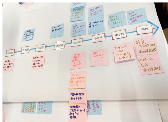
子どもの成長段階に合わせた子育ての悩みを付箋に書き出し、共有しました。