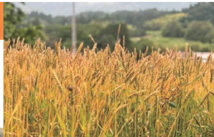
6月収穫期を迎えた麦畑

パン・菓子工房ouiでは、材料費や光熱費の高騰など厳しい状況が続く中でも、製造工程や販売方法を工夫しながら、オリジナルパンの製造・販売を継続しています。地域内外のイベントやマルシェ「東京蚤の市」の出店を通じた販路開拓にも力を入れ、2024年度は計12回の出店を行いました。県内各地での出店に加え、東京で開催される大規模マルシェへの初出店にも挑戦しました。こうした取組みは、売上の確保にとどまらず、南三陸町の食材や麦づくりなど、地域の取組みを広く発信する機会となっています。