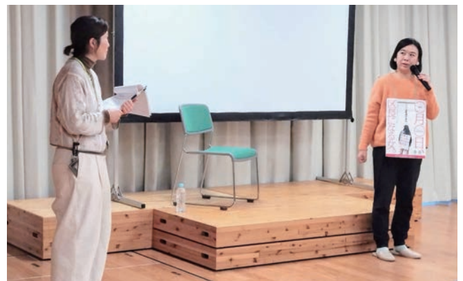
上映後の監督トークセッションの様子。撮影秘話や作品への思いが語られました。

2024年12月、宮城県「みやぎ女性活躍ネットワーク事業（気仙沼・登米地域）」の一環として、映画上映会『〇月〇日、区长になる女』を南三陸町にて昼夜2回開催しました。参加者は計59名で、そのうち町内からの参加は45%でしたが、近隣自治体からの参加が半数を超え、本テーマへの関心の高さがうかがえました。同町では、ジェンダーギャップ解消に向けた取り組みが今後の課題とされる中、本事業は地域に新たな問題提起を行う機会となりました。参加した女性たちの問題意識は高く、上映後、多くの質問や意見交換が行われました。女性たちが安心して対話できる場を継続的につくとともに、地域や家庭における固定的な価値観を更新していく機会を、今回のような映画鑑賞など参加しやすい形で重ねていくことの重要性が確認されました。